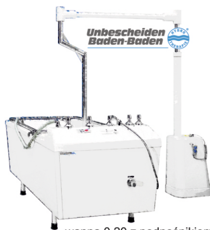
wanna 0.20 z podnośnikiem