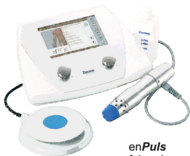
enPuls fala uderzeniowa