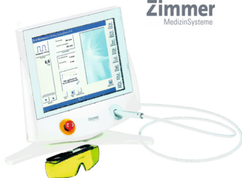
OptonPro laser wysokoenergetyczny