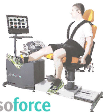
iso force diagnostyka rehabilitacja trening