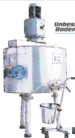
mieszalnik do borowiny