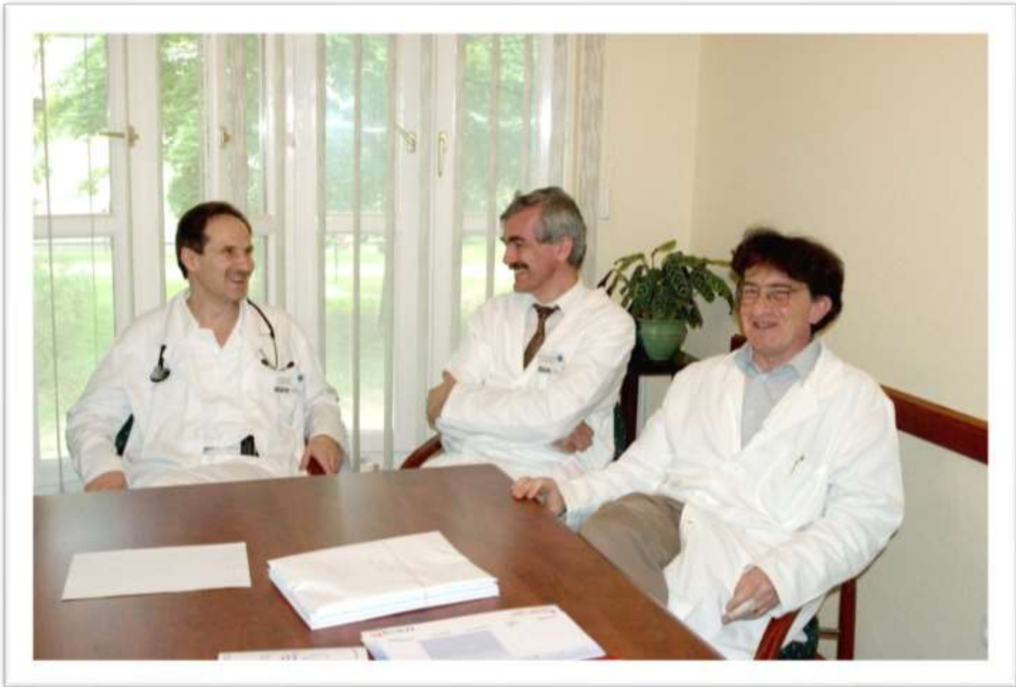
A Debreceni Triumvirátus