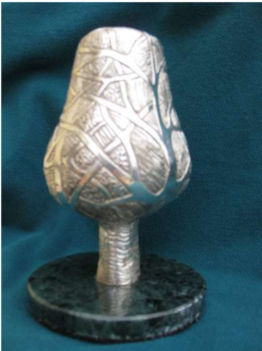
Vese-életfa, készítette Kő Pál, 2008